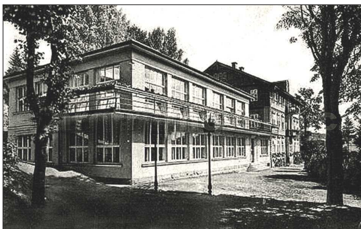
Lékárna v třicátých letech