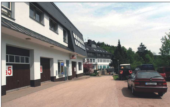
Současná budova školy