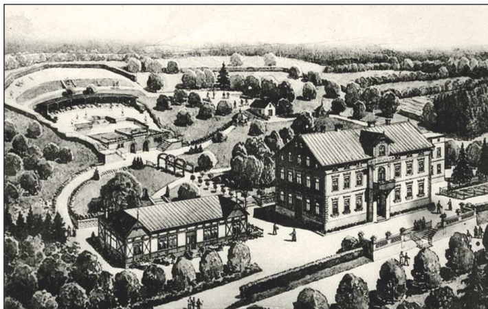
Pension Císařské Lázně (kolem roku 1900)