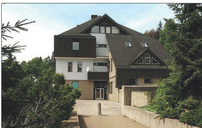
Současná budova školy